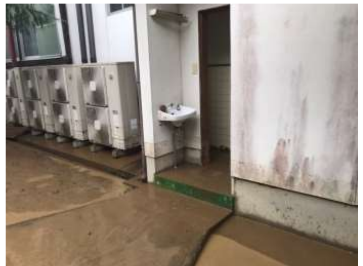
【外トイレ・室外機】